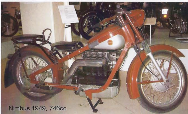
Nimbus 1949, 746cc