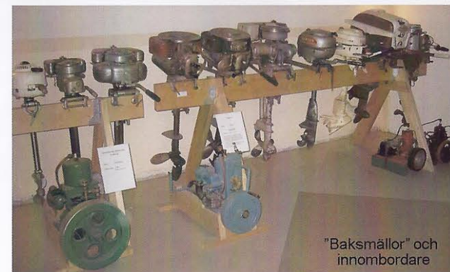
“Baksmällor” och innombordare