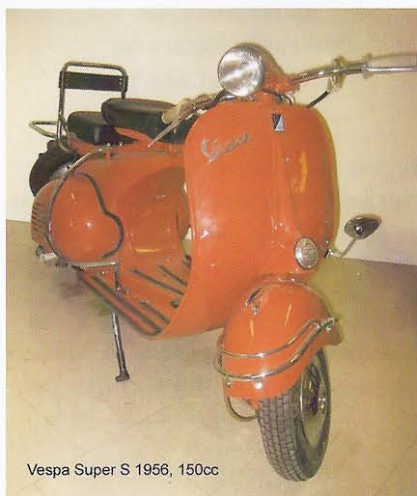
Vespa Super S 1956, 150cc

Mer än 150 veteranmotorcyklar renoverade till bruksskick och i de flesta fall registrerade och körklara finns på klubbens museum i Dals-Ed