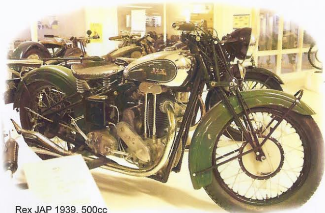
Rex JAP 1939, 500cc